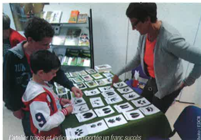
L'atelier traces et indices a remporté un franc succès

La Maison de la Chasse, de la Pêche et de la Nature a ouvert pour la première fois ses portes le samedi 24 mai 2014 à La-Tour-de-Salvagny.