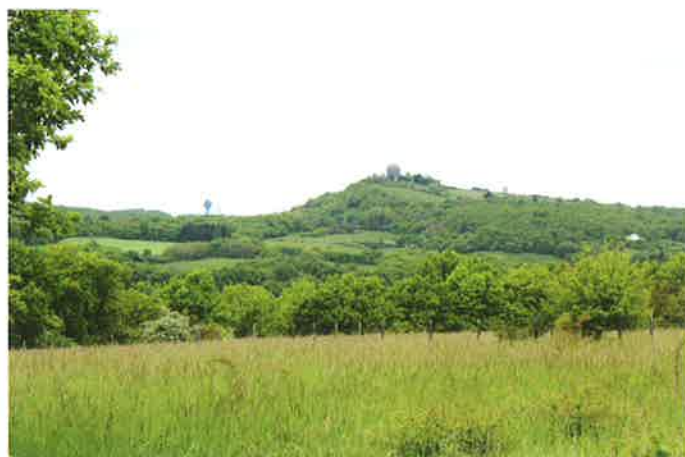
Exemple de parcelles entretenues par les chasseurs dans les Monts d'Or grâce à un partenariat avec le Syndicat Mixte des Monts d'Or

Ainsi dans le Rhône, près de 160 parcelles représentant 100 ha de terrain appartiennent aux chasseurs. Constitués de haies, boqueteaux, forêts de feuillus, landes, zones humides et tourbière ces parcelles sont ainsi protégées de l'urbanisation tout en recevant une gestion adaptée à leurs enjeux faunistique et floristique.