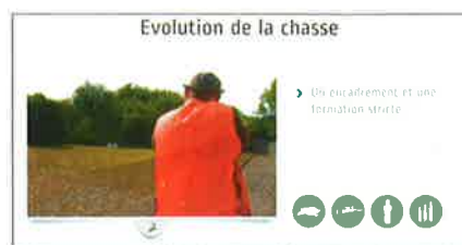
Ci-contre : Extrait du film sur la sécurité projeté en avant-première lors de la réunion de Mansols